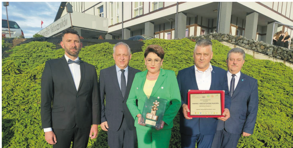
Dom Przyjęć Karina został doceniony statuetką Lidera Przedsiębiorczości.

Dom Przyjęć Karina otrzymał tytuł Lidera Przedsiębiorczości 2023 powiatu wodzisławskiego. Swoje statuetki odebrało 10 przedsiębiorców z terenu powiatu wskazanych przez samorządy gminne oraz organizację cechową.