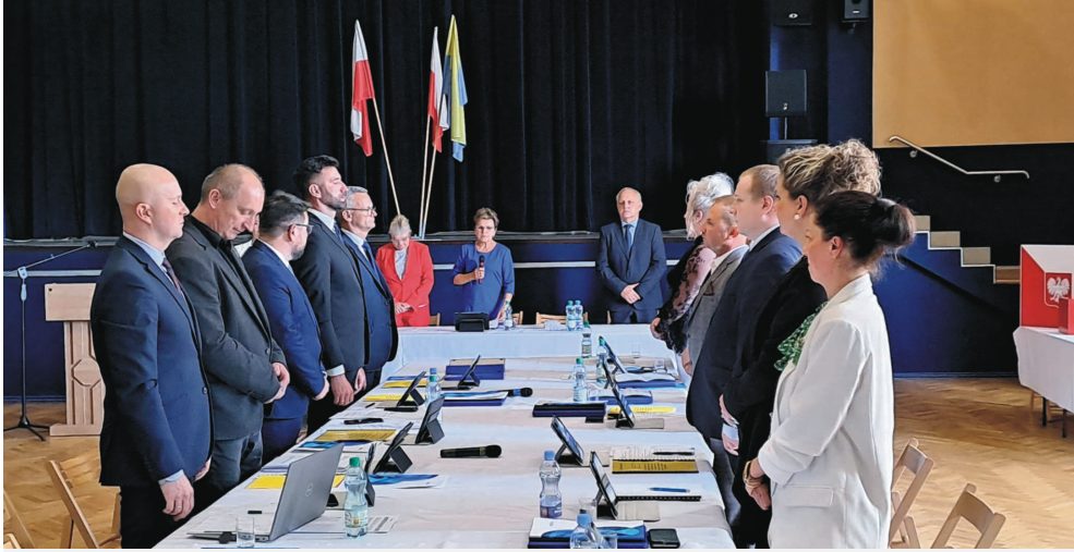
Radni złożyli ślubowanie i oficjalnie rozpoczęli kadencję.

Tegoroczne wybory samorządowe wyłoniły w Pszowie nowe władze miejskie. Zmienił się również skład Rady Miejskiej. Radni złożyli ślubowanie i wybrali przewodniczącego.