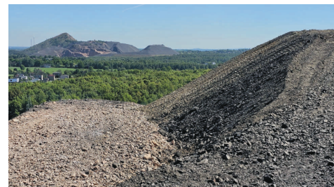
Hałda Wrzosa I w Pszowie.

Na hałdzie Wrzosa I w Pszowie zakończono doraźne prace zabezpieczające. Wykonane zostały na zlecenie Spółki Restrukturyzacji Kopalń. Specjalna okrywa powstrzymuje pożar na zwałowisku.