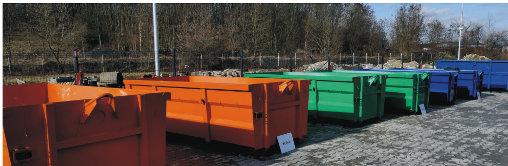
Więcej odpadów rozbiórkowych można oddać na pszowskim PSZOK-u.

Na prośbę mieszkańców regulamin Punktu Selektywnej Zbiórki Odpadów Komunalnych uległ zmianie w zakresie zbiórki odpadów budowlanych i rozbiórkowych. Aktualnie w ciągu 2 lat można oddać w ramach opłaty śmieciowej 1,5 tony takich właśnie odpadów.