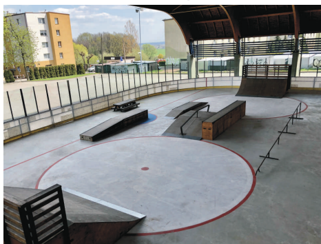
Skatepark już otwarty.

Chcąc skorzystać z kortów, należy je wcześniej zarezerwować. Za atrakcje można płać kartą. Rezerwacja kortów tenisowych i stołu do ping-ponga: tel. 696 009 303 (obsługa obiektu).