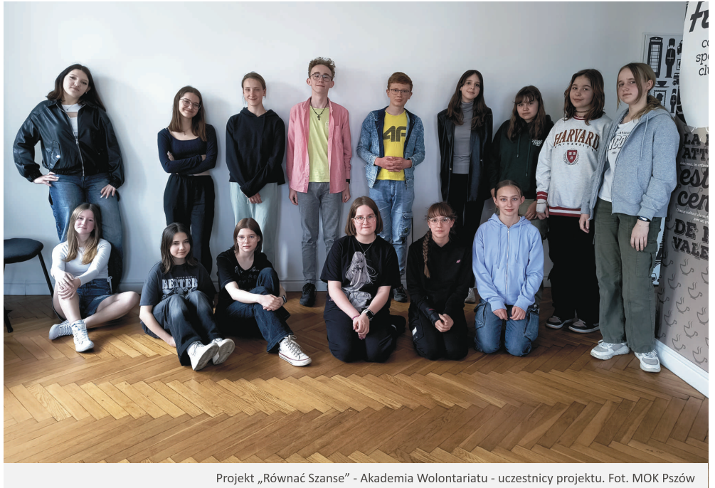
Projekt „Równać Szanse” - Akademia Wolontariatu - uczestnicy projektu.

działalność Akademii Wolontariatu, integracja uczestników, rozwinięcie ich kompetencji społecznych i emocjonalnych, poznanie ich mocnych stron, zwiększenie ich wiary w siebie, zaangażowanie w działania na rzecz lokalnych społeczności, kształtowanie wśród młodych postaw prospołecznych oraz rozwijanie potrzeby uczestnictwa w życiu lokalnym. Wierzymy, że ten projekt jest początkiem działań młodzieży na rzecz naszego miasta.