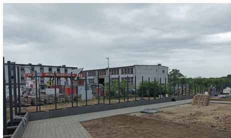
Wokół obiektu powstaje nowe ogrodzenie oraz konstrukcje ściany wertykalnej.