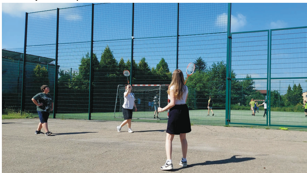
Przyszkolne boiska SP1, SP2, SP3 będą udostępnione dla wszystkich.

Boiska przy Szkołach Podstawowych nr 1, 2 i 3 w Pszowie są dostępne w weekendy, także podczas wakacji. Ruszył ministerialny program „Aktywna szkoła” skierowany do dzieci jak i dorosłych.