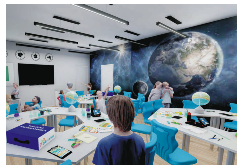
Przyrodnicze centrum nauki

Szkoła Podstawowa nr 4 w Pszowie zdobyła prestiżowe wsparcie Wojewódzkiego Funduszu Ochrony Środowiska i Gospodarki Wodnej w Katowicach. Projekt "Zielona Pracownia 2024" został wybrany spośród 148 wniosków i otrzymał ponad 47,9 tys. zł dofinansowania.