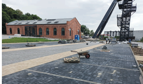
Wyznaczono miejsca parkingowe, a w najbliższym czasie rozpoczną się nasadzenia drzew i krzewów. Fot. UM

Na dobrej drodze są również prace wewnątrz budynku. Układana jest posadzka, na ścianach kładziona jest gładź. Trwają również prace związane z montażem windy, instalacjami elektrycznymi i sanitarnymi.