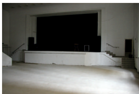
Sala widowiskowa po remoncie w 2000 r.