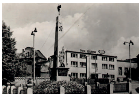
Budynek MOK w latach 80-tych XX w.