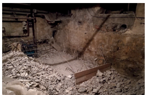
Piwnice MOK przed gruntownym remontem w 2016 r.