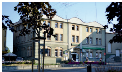
Budynek MOK po termomodernizacji w 2007 r.