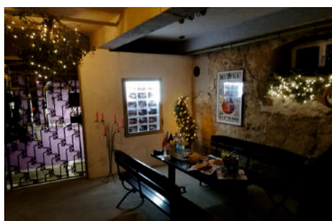
Sala kameralna w piwnicach MOK - stan obecny.