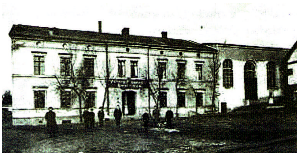
Budynek MOK w drugiej połowie XIX w.

W ciągu ćwierćwiecza przez pszowskim MOK przewinęła się czołówka polskich artystów, głównie sceny rockowej. Nie sposób wymienić wszystkich. Wyróżnikiem instytucji są także od lat silnie działające grupy taneczne, które zdobywają laury na najważniejszych festiwalach tanecznych w kraju. W MOK-u aktywnie działają koła emerytów, a także organizacje które wcześniej funkcjonowały w strukturach KWK „Anna”. MOK już teraz rozpoczyna przygotowania do przyszłorocznych obchodów swoich 25 urodzin.