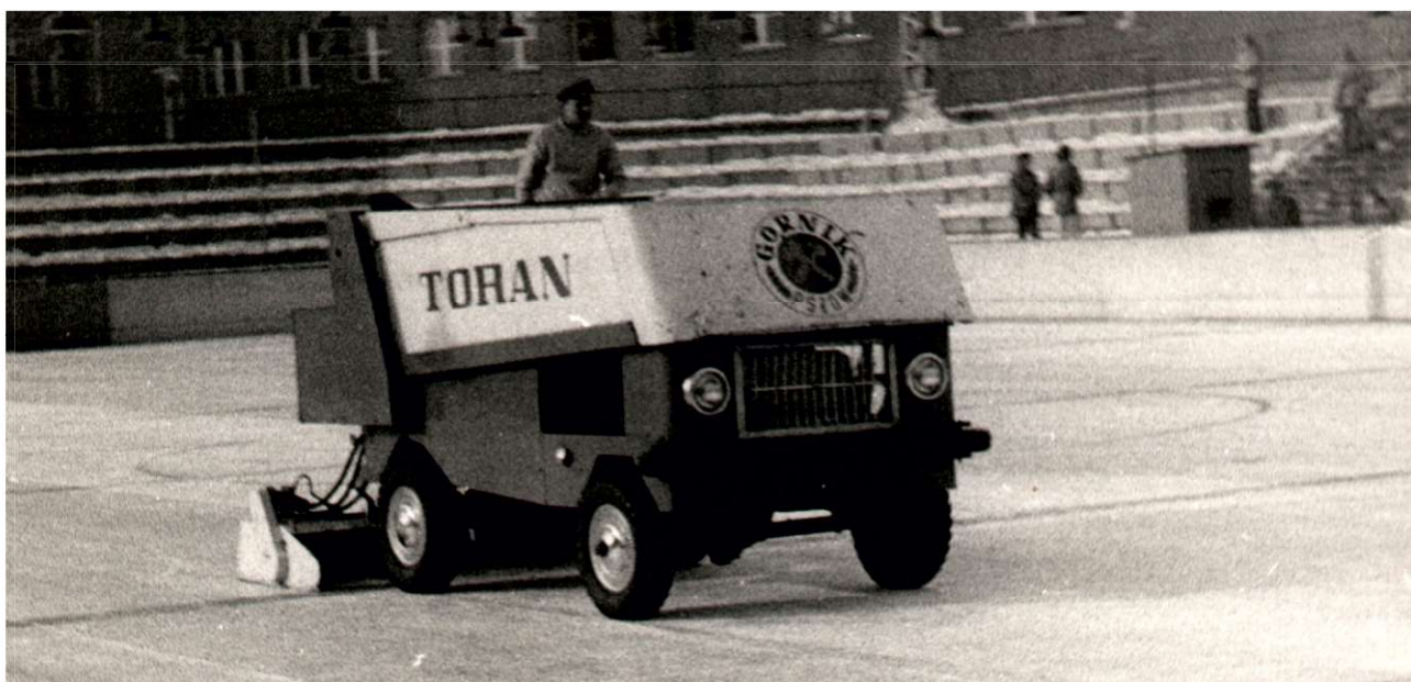
Maszyna do konserwacji i pielęgnacji tafli lodu

Uchwałą Prezydium Miejskiej Rady Narodowej w Pszowie w 1970 roku powołano Społeczny Komitet Budowy Sztucznego Lodowiska. 3 lipca 1970 roku rozpoczęła się największa w historii czynu społecznego w Pszowie budowa. 22 grudnia 1971 roku lodowisko zostało oficjalnie ukończone, a tafla gotowa do przyjęcia pierwszych łyżwiarzy. Lodowisko nazwano „Toran”, a uroczystość otwarcia uświetnił mecz hokejowy pomiędzy klubami Katowic i Jastrzębia. Na początku lat 90 – tych XX wieku, kopalnia „Anna” przestała finansować lodowisko, a kilka lat później zdewastowany obiekt przekazała gminie Pszów.